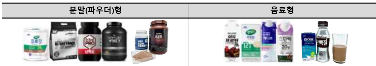
[ 시험대상 제품 ]

* 최근 6개월 이내 단백질 보충제 섭취 경험이 있는 소비자 1,000명 대상(한국소비자원, 2023.2.)