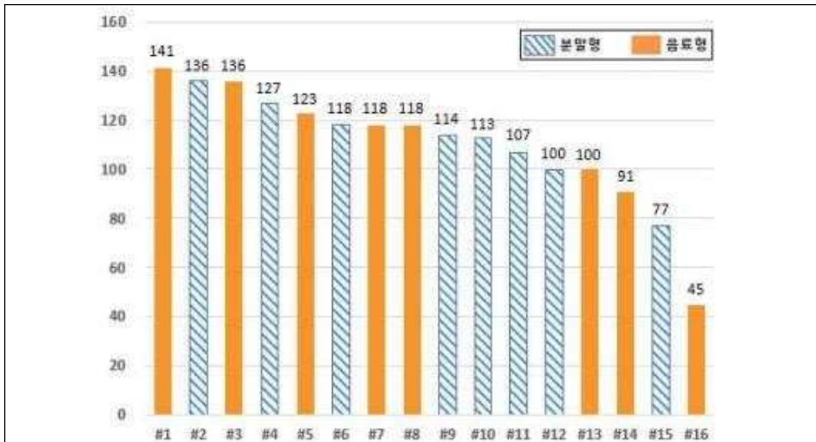
[ 제품별 아미노산스코어(1회 섭취량) ]