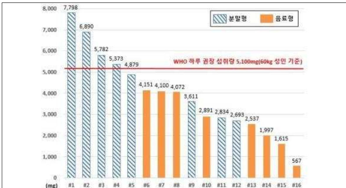
[ 제품별 BCAA 함량(1회 섭취량) ]